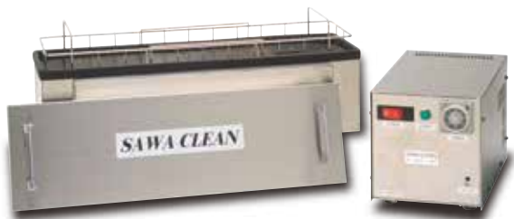
※洗浄かごはオプションです。